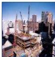
Planung- und Ausführung